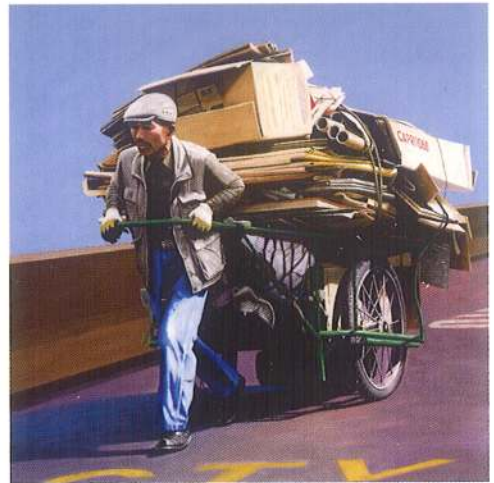
REPARTIMENT GLOBAL 2005 (Acrilie i metall s/ llenç, 65x65) Roma MERCAT GLOBAL 2009 (Acrilie s/ llenç, 65x65) Lublin