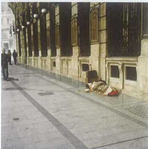
SENSE SOSTRE 2009 (Acrílic s/ llenç, 65x65) Madrid