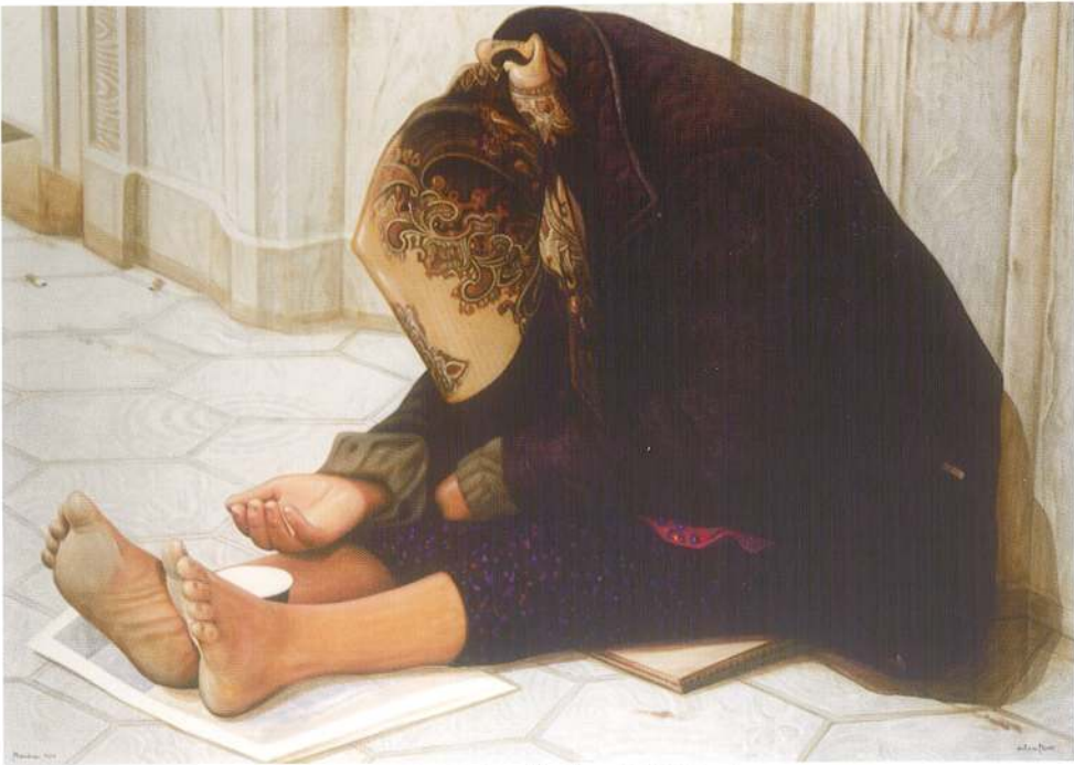
MENDICAR 2010 (Acrílic s/ llenç, 114x162) Barcelona

no és cert que un temps dolent prepare un de millor si tens paciència