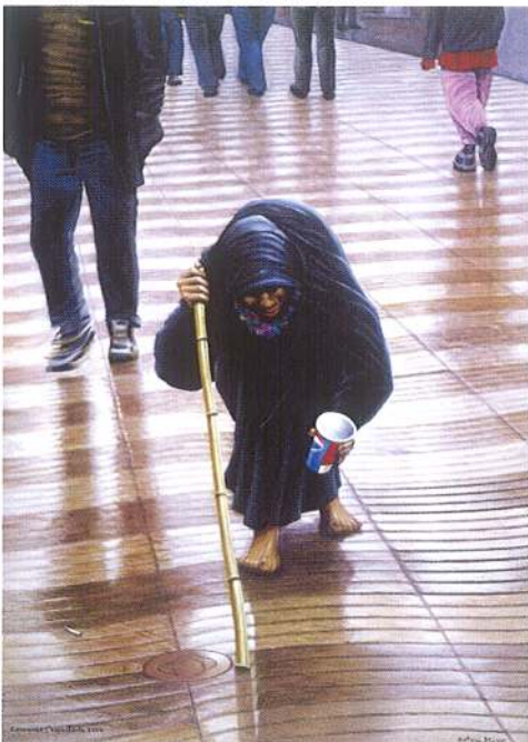
COMENÇA L'ESPECTACLE 2004 (Acrílic s/ llenç, 92x65) Barcelona Contraportada: MANIFESTACIÓ 2010 (Acrílic s/ llenç, 162x228-díptic) Balçans